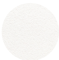
Hz Akustikpuds 03