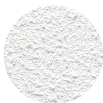
Hz Akustikpuds 09