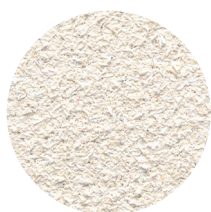
Hz Akustikpuds 07